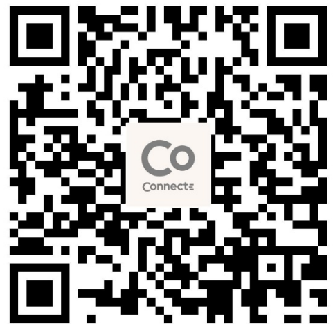
QR kode for Connecte app nedlastning